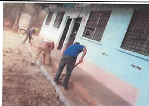
Foto 6: Construccion de estufa rural, con instalacion de plancha y chimenea

Observación: Si es necesario se pueden agregar hojas adicionales y actualizar el número de hojas.